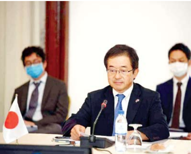
ឯកឧត្តម មិកាមិ ម៉ាសាហ៊ីរ៉ូ ឯកអគ្គរាជទូតជប៉ុនប្រចាំព្រះរាជាណាចក្រកម្ពុជា។

ឆ្នាំនេះ ជាខួបលើកទី៣០នៃប្រតិបត្តិការថែរក្សាសន្តិភាពរបស់អង្គការសហប្រជាជាតិ (PKO) នៅកម្ពុជា។ បន្ទាប់ពីការសម្រេចបាននៃកិច្ចព្រមព្រៀងសន្តិភាពទីក្រុងប៉ារីសឆ្នាំ១៩៩១ អាជ្ញាធរបណ្តោះអាសន្ននៃអង្គការសហប្រជាជាតិ (UNTAC) បានចាប់ផ្តើមប្រតិបត្តិការក្នុងឆ្នាំ១៩៩២ ដែលដឹកនាំដោយលោក អាស៊ី យ៉ាស៊ីស៊ី (AKASHI Yasushi)។ កម្ពុជា គឺជាប្រទេសដំបូងដែលជប៉ុនបានបញ្ជូនក្រុមប្រតិបត្តិការថែរក្សាសន្តិភាពរបស់ខ្លួនមកបេសកកម្ម PKO។ យើងពិតជាមានមោទនភាពខ្លាំង ដែលប្រទេសជប៉ុនបានរួមចំណែកយ៉ាងសំខាន់ ក្នុងដំណើរការសាងសន្តិភាព ព្រមទាំងការស្តារឡើងវិញ និងអភិវឌ្ឍប្រទេសកម្ពុជាជាបន្តបន្ទាប់។ ពាក់ព័ន្ធនឹងចំណុចនេះ ខ្ញុំសូមថ្លែងអំណរគុណយ៉ាងជ្រាលជ្រៅចំពោះប្រទេសកម្ពុជា ចំពោះតួនាទីសកម្មនាពេលថ្មីៗនេះ ក្នុងការរួមចំណែកថែរក្សាសន្តិភាពក្នុង