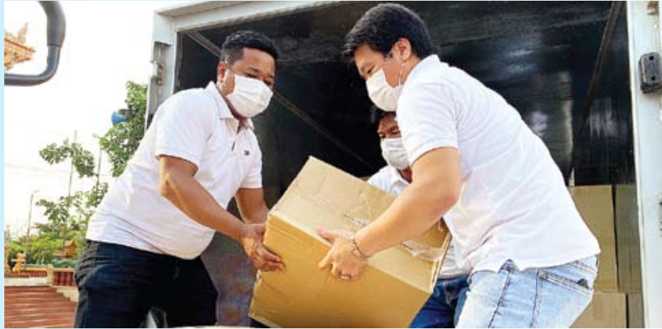
បុគ្គលិក JTI រៀបចំកញ្ចប់ស្បៀងអាហារ ដើម្បីចែកជូនដល់គ្រួសារដែលខ្វះខាត ក្នុងអំឡុងពេលការរាតត្បាតជំងឺកូវីដ១៩នៅក្នុងសហគមន៍ កាលពីឆ្នាំ២០២១ នៅរាជធានីភ្នំពេញ។