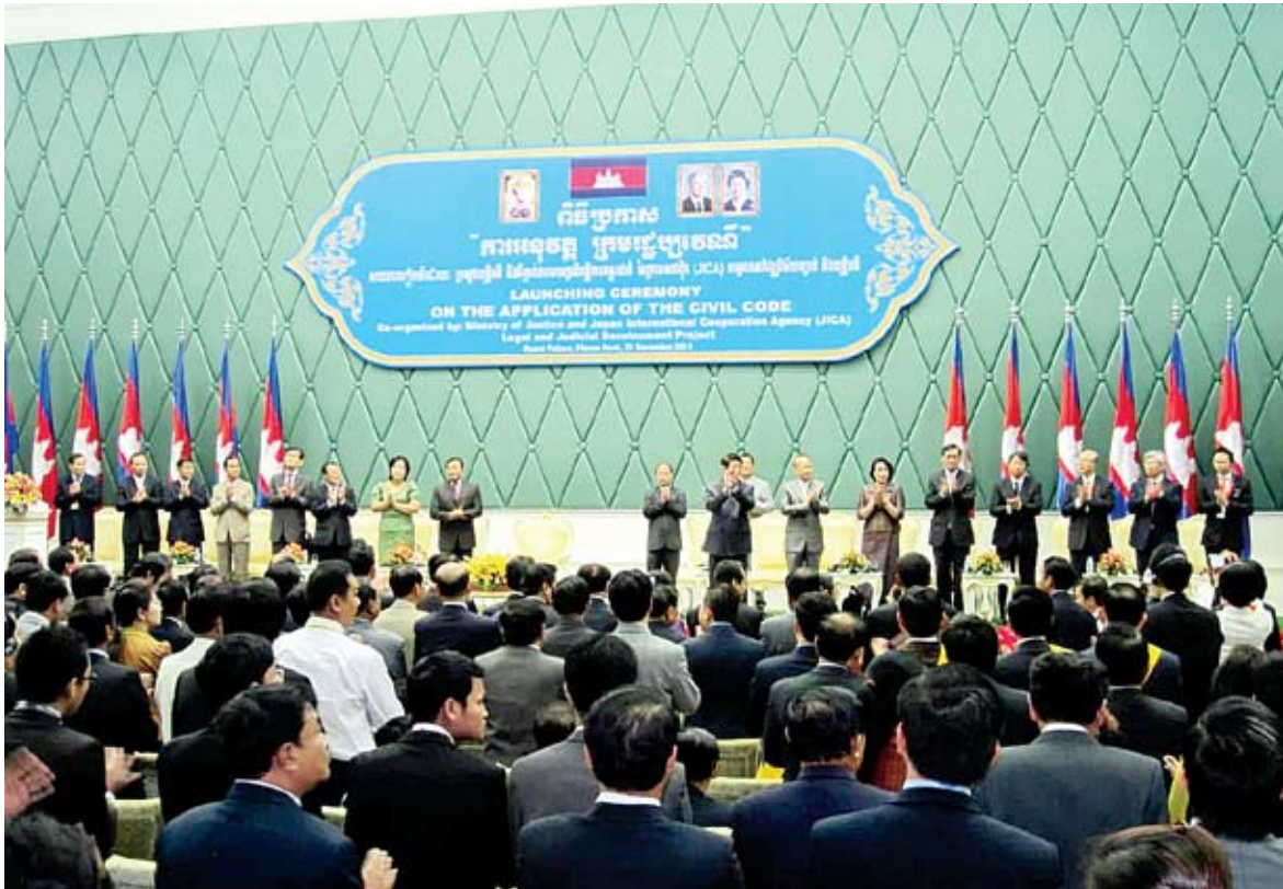
ពិធីប្រកាសការអនុវត្ត ក្រមរដ្ឋប្បវេណី កាលពីថ្ងៃទី២១ ខែធ្នូ ឆ្នាំ២០១១។

២០១១ ប្រទេសកម្ពុជាបានចាប់ផ្តើមអនុវត្តក្រមរដ្ឋប្បវេណី ដែលនេះគឺជាការបោះជំហានថ្មីមួយ ដែលប្រទេសកម្ពុជាមានបទប្បញ្ញត្តិសារជាតុលើវិស័យរដ្ឋប្បវេណី ដែលអាចឆ្លើយតបនិងដោះស្រាយនូវគ្រប់បញ្ហាដែលទាក់ទងនឹងសិទ្ធិនិងកាតព្វកិច្ចរបស់ប្រជាពលរដ្ឋពាក់ព័ន្ធនឹងផ្នែករដ្ឋប្បវេណី។